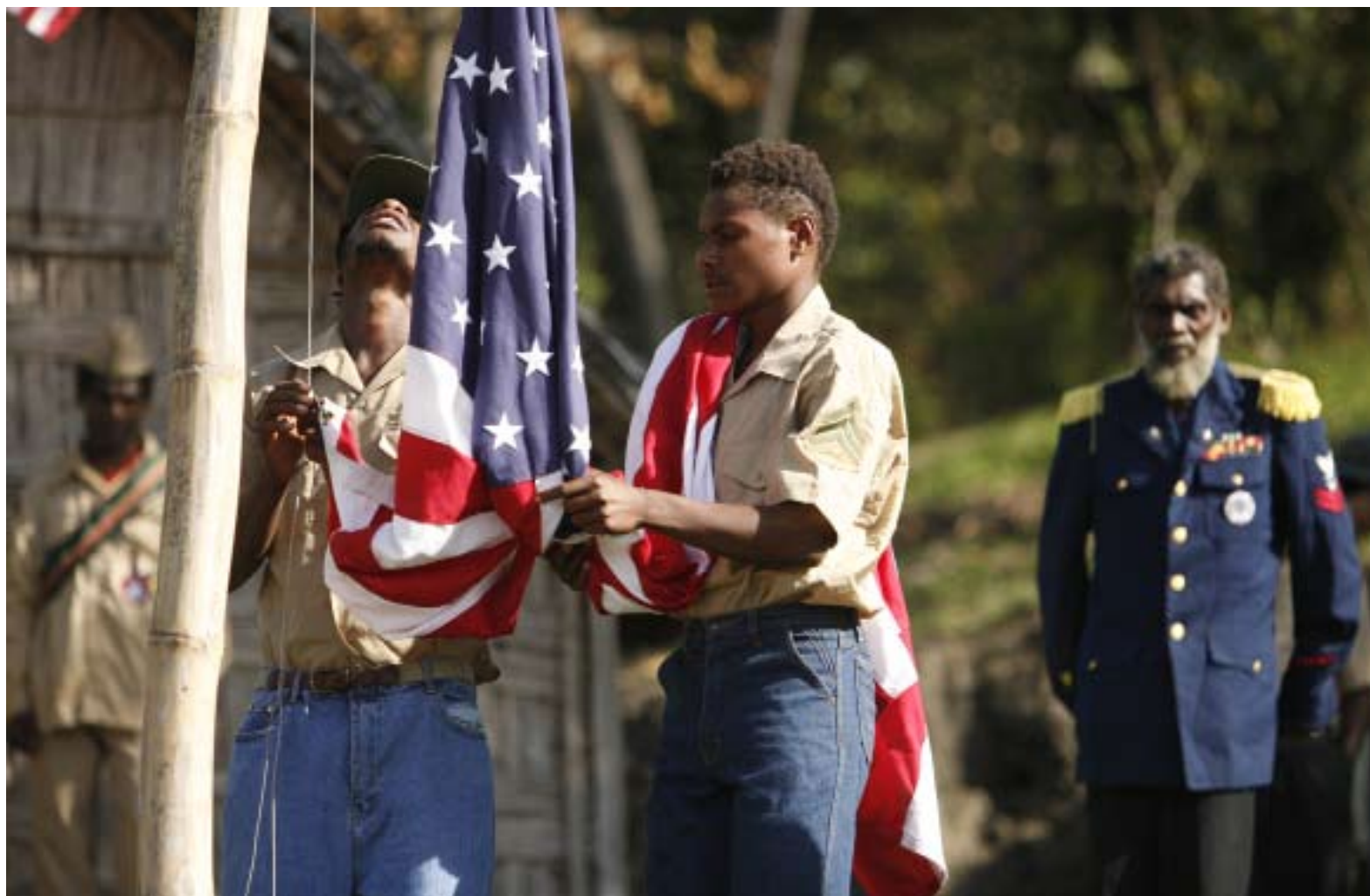
DE ULLA LOHMANN ET GENEVIÈVE DE LACOUR

Dans le silence de la plaine volcanique, un bruit sourd s'élève. Une colonne humaine fait vibrer le sol, couvert de cendre gris-noir par les éruptions. Comme dans toute armée, les hommes progressent au pas cadencé, manœuvrent sous les injonctions du chef. Le port de tête est altier, les visages concentrés et graves. Ces soldats se démarquent par leur tenue. Vêtus uniquement d'un pantalon en jean, ils marchent pieds nus, les lettres « USA » peintes en rouge sur leur torse. D'un même mouvement, les hommes font claquer une main sur leur « fusil » en bambou, puis changent leur arme factice d'épaule. Les plus âgés et les plus déterminés figurent en tête de colonne. Les